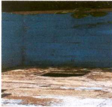
Foto1: retirando el inodoro de cemento para colocar un taza de baño lavable