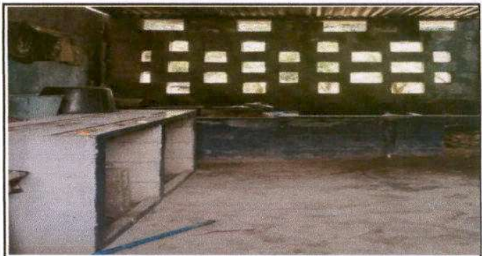
Foto 4: arreglando la cocina, relleno la pila anterior para ser utilizada para cocinar