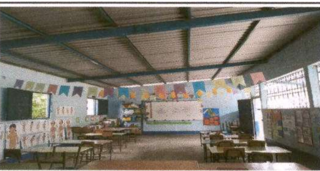
Foto 5: falta un división en el aula para que sean dos espacios 1 para preprimaria y otro para 1ro, 2do y 3ero.