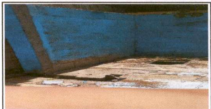
Foto 6: Arreglando baños para tener un espacio a parte para niños y niñas

Observación: Si es necesario se pueden agregar hojas adicionales y actualizar el número de hojas.